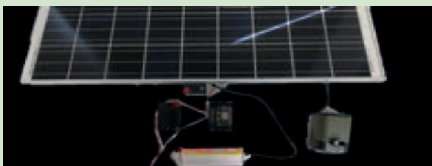
Gambar 3. Penggunaan sistem solar dalam kajian ini.

Selain itu, antara teknologi yang telah dibangunkan dalam sistem ini ialah Reka Bentuk Prototaip Penuaian Air Hujan dan Sistem Pengairan Solar untuk Ladang Skala Kecil. Sistem pengairan semasa di Taman Tanaman Dapur yang digunakan oleh FBIM dikendalikan secara manual dan sumber airnya langsung dari Syarikat Air Terengganu (SATU). Kos penyelenggaraan yang dikeluarkan untuk mengekalkan sistem semasa adalah agak mahal. Justeru, berdasarkan pemerhatian faktor-faktor ini, satu reka bentuk prototaip telah dibangunkan untuk memperbaiki sistem pengairan dengan memanfaatkan sumber alam semula jadi. Konsep projek ini adalah dengan menggunakan air hujan dan matahari sebagai sumber yang boleh diperbaharui. Dengan penggunaan prototaip ini, ia dapat memanfaatkan sumber tenaga hijau yang banyak sehingga menghasilkan kemajuan teknologi yang mengoptimumkan penggunaan tenaga (Gambar 3).