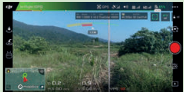
Gambar 2. Output daripada antaramuka aplikasi DJI GO 4

Kadar pertumbuhan rumput Napier juga dapat diukur secara manual dan secara teknologi dron (Gambar 2). Pengukuran ketinggian pokok dengan penginderaan jauh sangat tepat dan dapat dilakukan dengan lebih sedikit masa dan kos berbanding menggunakan kaedah tradisional atau secara manual.