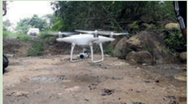
Gambar 1. Penggunaan Dron untuk tujuan penyelidikan

bagi pengeluaran tenusu dan makanan yang mempunyai nilai nutrisi yang tinggi (Kamaruddin et al. 2018). Oleh itu, penggunaan UAV adalah untuk membezakan ketinggian rumput Napier dua plot yang berbeza menggunakan dron (Gambar 1).